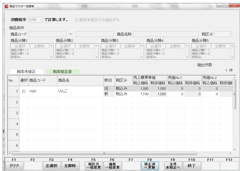
【商品マスター一括更新】画面